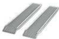
505 69 90-42 Lastramper

per par. Ramperna säljs i par. Dimensioner: 200x2000x50 mm.