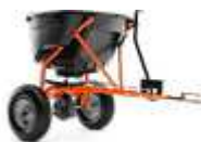
967 02 72-01 Spridare 75

En spridare av hög kvalitet för professionell användning. En elektriskt manövrerad spridare som garanterar jämn spridning. Skyddsgallret överst kan också användas som en skiljeväg när man använder gödningsmedel, salt, sand eller fint grus med en storlek upp till 30 mm. När spridaren används för vinterbruk skall ridern försees med hjulvikter och snökedjor. Av säkerhetsskäl bör inte spridaren användas vid lutning mer än 10 grader åt något håll.