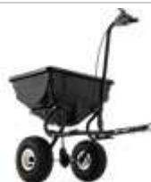
954 12 00-46 Spridare 30

Bogserad spridare med enkel justering av flöde, för större områden. Sluten kommersiell växellåda för jämna drivning och enkelt underhåll och stora däck för enkel manövrering. Slitstarkt nylonkydd inkluderat. Kan användas för att sprida gödning och frön i din trädgård samt för ismältning under vintern. Om spridaren används med salt, se till att rengöra spridartratt och rör efter användning för att förhindra korrosion