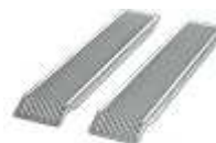
505 69 90-42 Lastramper

Lastramper av havsvattentålig aluminium med den välkända halkskyddsytan O3, som ger alla slags hjul ett gott grepp även i våta och hala miljöer. Lastramperna passar väl för användning på släpkärror med en maximal höjd om 700 mm och för en total belastning om 450 kg per par. Ramperna säljs i par. Dimensioner: 200x1500x35 mm.