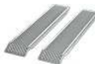
505 69 90-40 Lastramper

För skärning och justering av gräskanter. Inställbart skärdjup. Vändbar för att lägga tiltan på ut- eller insidan.